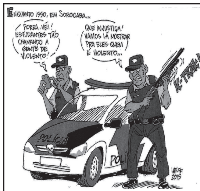
Charge de Latuff sobre ação da polícia em Sorocaba

Mais uma vez a truculência de grupos de direita, anônima e covardemente se manifesta pelas redes sociais, buscando amedrontar aqueles que denunciam a opressão de organizações que só deservem à população. Veja abaixo a declaração do Grupo de Pesquisa.