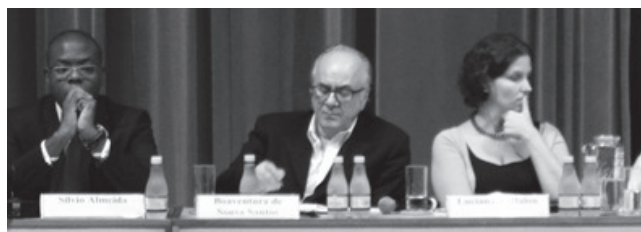
A mesa do debate tendo ao centro o professor Boaventura